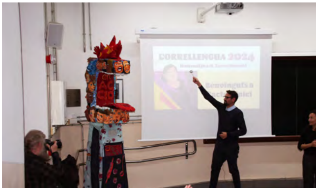
Moment del bateig de la gegantona de la CAL

Durant la celebració també va tenir lloc la lectura del Manifest del Correllengua 2024 a càrrec de l'autor, el filòleg i escriptor Jordi Badia .