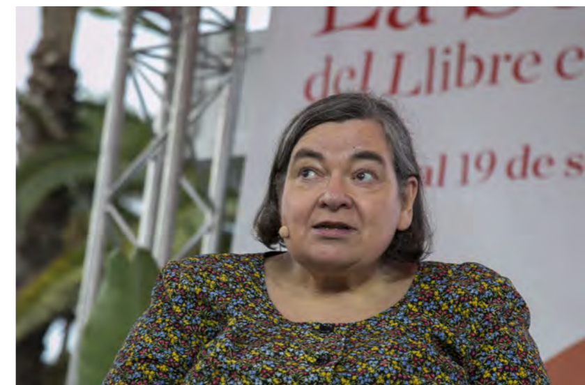
Foto de La Setmana del Llibre en Català, 2021

Llibre: El futur del català depèn de tu (La Campana, 2020)